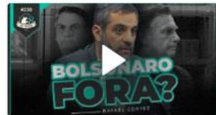
Exemplo do programa Touros & Ursos em distribuição multimídia

O Julgamento de Bolsonaro e o cenário eleitoral com Lula e Tarcísio: Qual é o futuro do Brasil?