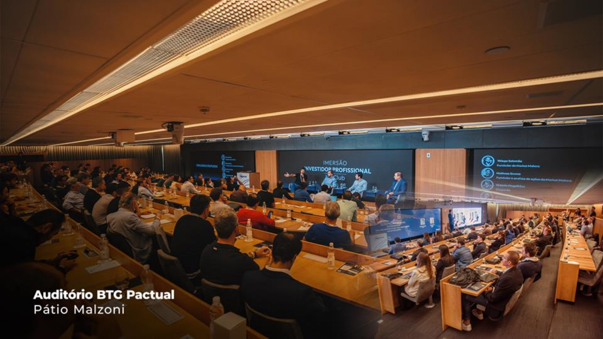
Auditório BTG Pactual Pátio Malzoni